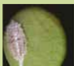
15 λεπτά μετά την εφαρμογή