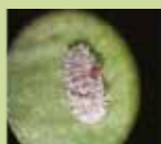
30 λεπτά μετά την εφαρμογή